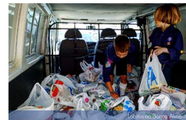
Lobitos no Banco Alimentar

Avizinham-se tempos de muita agitação, mas com mar de feição tudo irá correr pelo melhor. Ainda há grandes alegrias por viver até ao final do ano. Até lá!