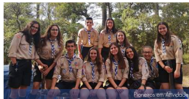
Pioneiros em Atividade

No dia 13 e 14 de abril, os Pioneiros encarnaram as tropas anglo-lusas e percorreram em raid uma parte das linhas de Torres Vedras, evacuando a população e preparando os fortes para a defesa contra os franceses. Desta forma treinaram a orientação, a autonomia e o espírito de Equipa.