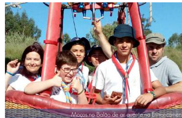
Moços no Balão de ar quente no Entroncamento

A nossa Flotilha participou no Acamizade promovido pelo Agrupamento do Entroncamento e cada momento foi uma verdadeira surpresa positiva.. da abertura ao andar de balão de ar quente.