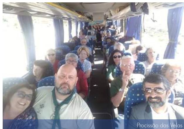
Procissão das Velas