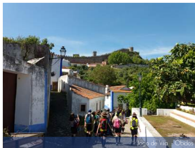
Jogo de Vila - Óbidos

Neste mês de junho tivemos mais uma edição das Tasquinhas de Ponte do Rol, de 19 a 22, onde apresentámos diversos petiscos, pratos e sobremesas. Escuteiros, pais e familiares, trabalharam lado a lado para dignificar o 1279. Os manjericos também marcaram presença neste evento, nas mãos dos nossos Lobitos.