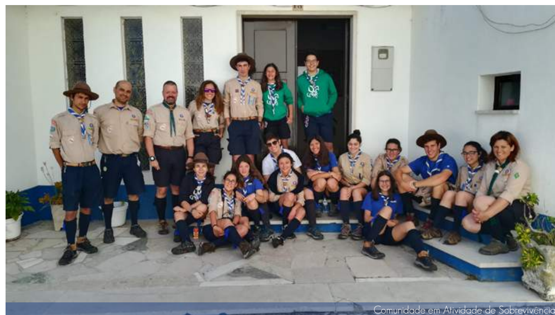
Comunidade em Atividade de Sobrevivência

A conclusão da atividade foi na participação da Eucaristia juntamente com as outras secções do nosso Agrupamento.