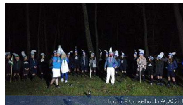
Fogo de Conselho do ACAGRUP

Os dias 26, 27 e 28 de abril ficaram marcados pela realização do ACAGRUP, o acampamento do Agrupamento 1022 Vimeiro! Este realizou-se na chamada Quinta do Joãozinho, em Alfeizerão. Na sexta-feira, ao reunir-se todo o Agrupamento em campo, começou por se desenvolver uma dinâmica de integração do imaginário: "Smurfs: A aldeia perdida" e de seguida a montagem das tendas. No dia seguinte houve a realização das construções, a abertura de campo, diversas atividades entre as secções e o Fogo de Conselho, em que a parte séria do mesmo foi preenchida pela Velada de Armas. No domingo, houve almoço partilhado em campo com os familiares, uma vez que logo a seguir se realizaram as Promessas dos elementos de cada secção, na Eucaristia em campo. Foi um ACAGRUP muito animado, em que se apostou num bom Fogo de Conselho e em boas peças cómicas, de modo a não "fugirmos" àquilo que é a grande essência de um Fogo de Conselho.