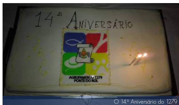
O 14.º Aniversário do 1279

Depois de mais uma participação na Festa Regional S. Jorge, onde o Agrupamento não falhou qualquer edição desde 2005, concentrámo-nos na sede de Agrupamento em Gondruzeira para um jantar partilhado preparado pelos pais e comemorámos o nosso 14.º Aniversário.