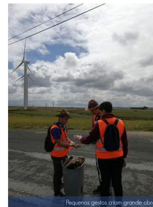
"Pequenos gestos criam grande obras"

No dia 18 de maio, os Escuteiros juntaram-se à iniciativa "Caminhar pelo Cuidado da Casa Comum", que pretende promover a saúde e a proteção da natureza, através da apanha do lixo ao longo da freguesia Santo Isidoro. Pequenos gestos criam grandes obras, como disse o Papa Francisco na Encíclica Laudato Si', "A Humanidade possui ainda a capacidade de colaborar na construção da nossa casa comum".