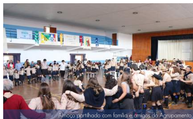
Almoço partilhado com família e amigos do Agrupamento