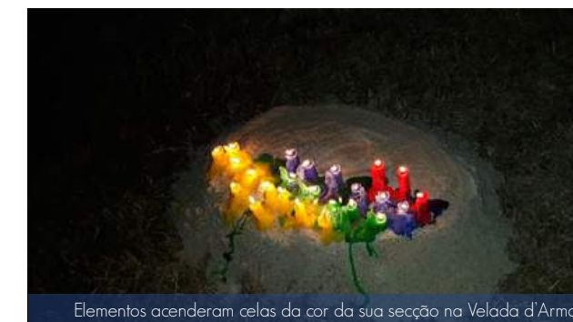
Elementos acenderam celas da cor da sua secção na Velada d'Armas

As Promessas do nosso Agrupamento são sempre um ponto alto do Ano Escutista. Na noite de 4 de Maio, os Escuteiros reuniram-se na sede numa cerimónia escutista, representando o encontro ao redor da fogueira para a Velada de Armas. No dia seguinte, junto da comunidade, os elementos realizaram a sua Promessa, seguindo-se um almoço de convívio na sede.