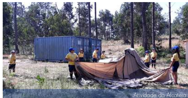
Atividade da Alcateia

A Alcateia teve mais um acampamento de preparação para o ACANUC com o imaginário "Capitão Cuecas" e os Lobitos foram uns super-heróis e venceram todas as batalhas com distinção.