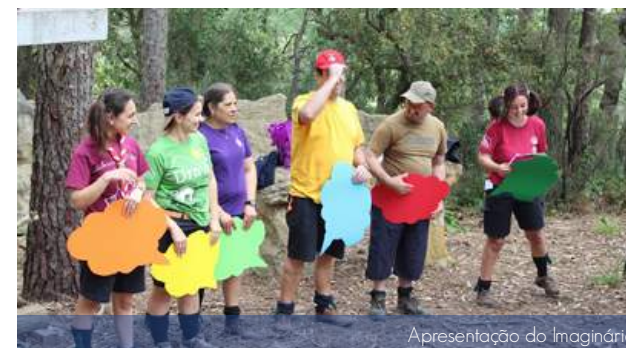
Apresentação do Imaginário

Aos 18 dias do mês de maio, o Agrupamento 1277 Encarnação - Mafra encontrou-se no Campo Escutista de Santo Isidoro para mais um inesquecível Acapromessas. A atividade teve como tema Imagina, sendo o imaginário: o que queres ser quando fores grande?