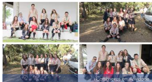
Caminheiros em Atividade

Este trimestre permitiu aos Caminheiros uma atividade de Clã com o imaginário "Vaiana" e um Clã "3-Caminheiras-mais-rico". "As nossas imperfeições ficam perfeitamente bem quando estão juntas", Clã 70 - S. João de Brito.