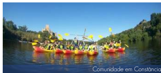
Comunidade em Constância