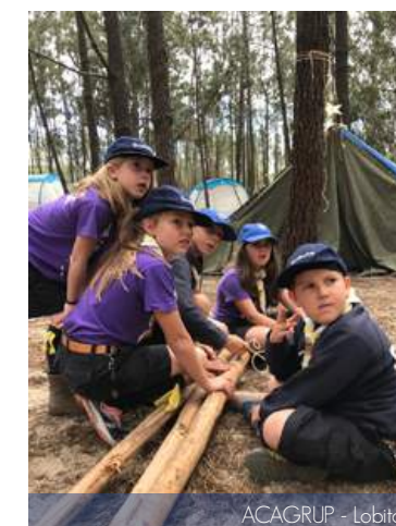
ACAGRUP - Lobitos

No dia 18 do mesmo mês, realizamos o nosso ACAGRUP no CEO. Embora a atividade fosse em Agrupamento, cada secção trabalhou individualmente o seu imaginário e algumas competências que eram importantes desenvolver para o ACANUC. O Fogo de Conselho foi em conjunto, assim como outros momentos que proporcionaram o convívio entre secções.