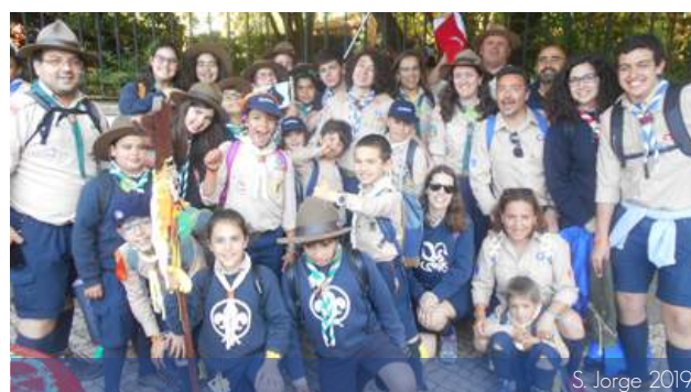
S. Jorge 2019

e, com eles, o almoço. Foram muito divertidos e faziam parte de um jogo maior: o fotoraíd. Esses jogos serviram para aprender e rever conhecimentos. Antes de regressarmos a casa, houve ainda tempo para a Eucaristia. Resumindo e concluindo, o São Jorge foi muito divertido e é uma atividade a repetir.