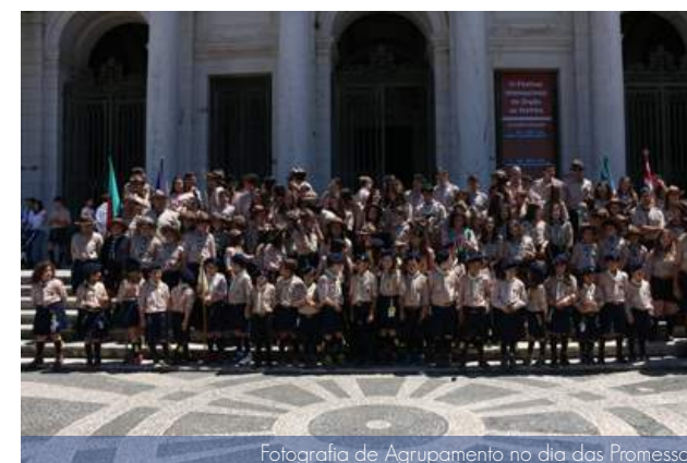
Fotografia de Agrupamento no dia das Promessas

Nos dias 11 e 12 de maio decorreu o Cerimonial das Promessas do nosso Agrupamento na Basílica do Palácio Nacional de Mafra. Diversos elementos das várias secções, Lobitos, Exploradores, Pioneiros e Caminheiros perante Deus, os seus familiares, amigos e restante comunidade fizeram a sua Promessa onde todos gritaram "Da melhor vontade" "Sempre Alerta" e "Servir". Os elementos da Alcateia, da Expedição, da Comunidade e do Clã receberam um novo lenço como prova do seu trabalho, dedicação e compromisso ficando também para nós este registo na história e tradição do nosso Agrupamento.