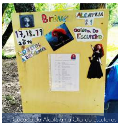
Caçada da Alcateia na Qta. do Escuteiros

Em cozinha selvagem colocaram, literalmente, "a mão na massa" e fizeram pão de rosca, pão com chouriço, espetadas de frango e chouriço em pau de louro, salada colorida, sumo natural de laranja e muita fruta. Aprenderam com as oficinas de socorrismo, construção, arruma a mochila e pioneirismo e símbolos de carta. Rezaram na eucaristia, divertiram-se (e assustaram-se) com o Jogo Noturno, refletiram e brincaram sobre o dia na Festa da Flor Vermelha e conheceram a Batalha através do jogo de vila. Foi uma Caçada em cheio!