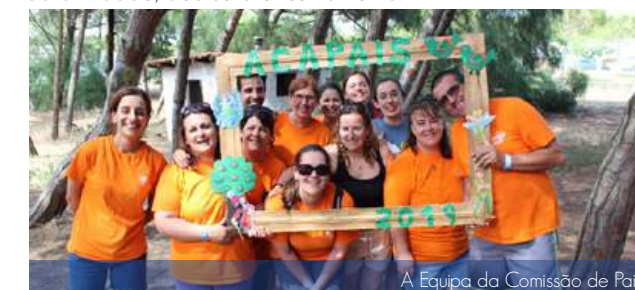
A Equipa da Comissão de Pais

Já de regresso a campo, foi o almoço, a desmontagem das tendas e as arrumações. Depois de uma pequena avaliação da atividade, deu-se o encerramento.