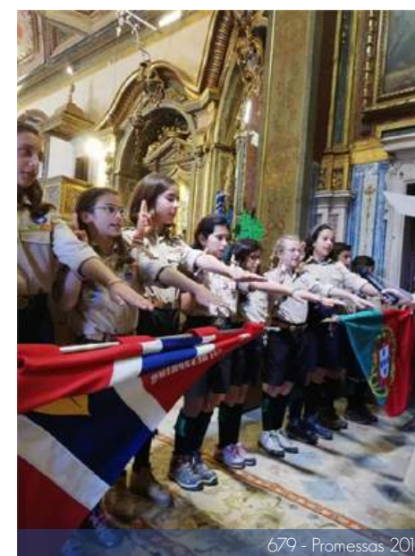
679 - Promessas 2019

Na sexta-feira, dia 24 de maio, o Agrupamento realizou a Velada D'Armas para a preparação das Promessas que se realizaram no Domingo seguinte, dia 26, na Eucaristia das 12h00, celebrada com a Comunidade na Igreja Paroquial de São Pedro - Ericeira. Realizaram a Promessa e foram investidos 7 Lobitos, 10 Exploradores e 2 Pioneiros. Seguiu-se um almoço partilhado, com todos os elementos do Agrupamento e respetivas famílias.