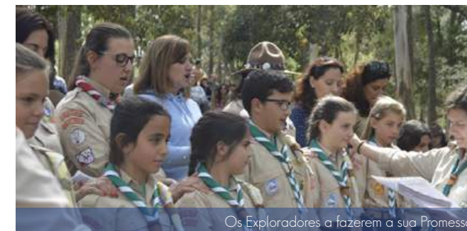
Os Exploradores a fazerem a sua Promessa

Pelas 15h00 iniciou-se a Eucaristia... tinha, então, chegado a altura de os Lobitos, os Exploradores, os Pioneiros, a Caminheira e os Candidatos a Dirigentes fazerem as suas Promessas e receberam os seus lenços. Após a missa, não faltou o corredor da morte que os Escuteiros que fizeram a Promessa tiveram de percorrer. E deu-se o encerramento.