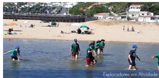
Exploradores em Atividade

De 31 de maio a 2 de junho, os Exploradores acamparam no Campo Escutista de Santo Isidoro, com o imaginário do filme "Divertidamente". Esta atividade foi o resultado da construção do Projeto Aventura da Patrulha Falcão. Ao longo destes dias fizeram construções, jogos de praia, concurso de culinária, jogo