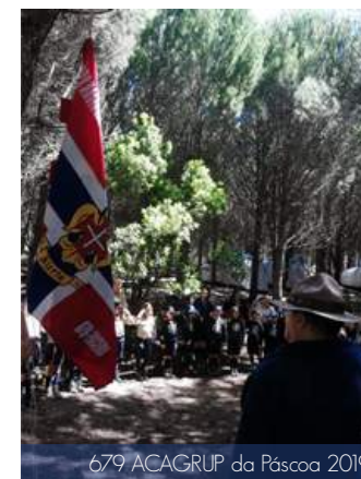
679 ACAGRUP da Páscoa 2019

Nos dias 11 e 12 de maio, o Agrupamento 679 Ericeira realizou o XIV ACAGRUP na zona da Serra de Sintra - Pedra Amarela, subordinado ao tema "Constrói a Casa Comum". A I, II e III Secções realizaram atividades de preparação para as Promessas, tendo a Expedição e a Comunidade realizado ainda trabalhos de preparação para o XIV ACANUC. Nesta atividade, o Agrupamento explorou a zona da Pedra Amarela e criou dinâmicas de interação entre os elementos das Secções.