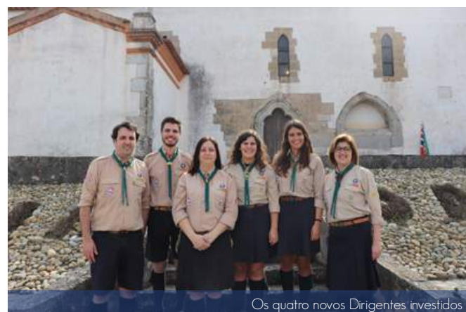
Os quatro novos Dirigentes investidos