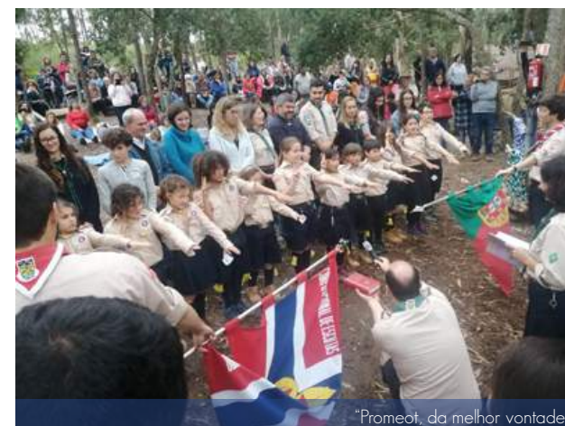
"Promoet, da melhor vontade"

Santo Inácio de Loyola tem acompanhado as atividades das secções, quer na preparação para o ACANUC (Pioneiros e Caminheiros), quer das atividades finais (Lobitos e Exploradores). A 1ª Secção deixa o seu testemunho: "Da Melhor Vontade" é a divisa que os Lobitos da Alcateia assumiram no passado dia 14 de abril, nas Promessas! Agora, já estão quase todos de Lenço Amarelo ao pescoço e com muita energia para continuar a crescer!