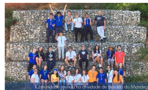
Comunidade reunida na atividade de descida do Mondego

A 27 de abril, os Pioneiros do 601 partiram à aventura e fizeram uma descida do rio Mondego de canoa. Foi uma atividade divertida e bastante aproveitada por todos. Contribuiu para o conhecimento e envolvimento dos novos membros na comunidade. Regressaram cansados, mas felizes.