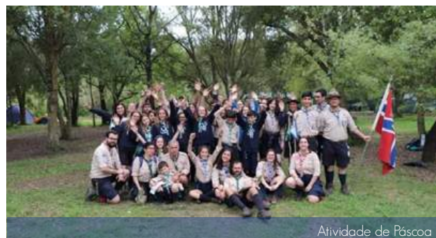
Atividade de Páscoa

Nos dias 12, 13 e 14 de abril realizou-se a atividade de Páscoa na Quinta do Escuteiro (Batalha) para Exploradores e Pioneiros com o imaginário: Escutismo para Rapazes. "Foi uma atividade desafiadora, no sentido em que muitos de nós executaram o seu primeiro RIN (raid individual noturno), mas também foi uma atividade que nos ajudou a tentar, da melhor forma, executar as atividades que nos eram propostas".