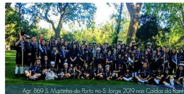
Agr. 869 S. Martinho do Porto no S. Jorge 2019 nas Caldas da Rainha