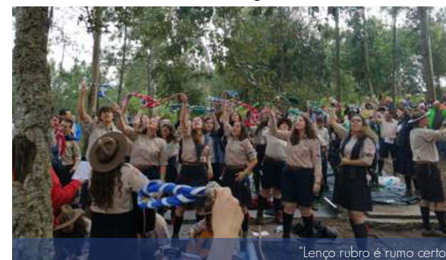
"Lenço rubro é rumo certo"