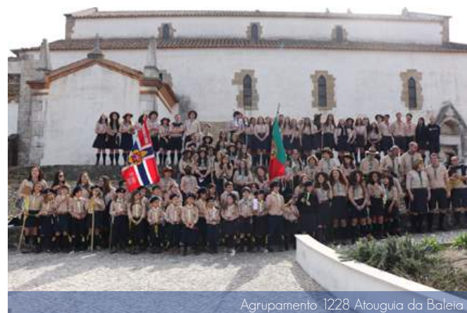
Agrupamento 1228 Atouguia da Baleia