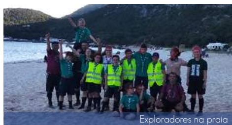
Exploradores na praia