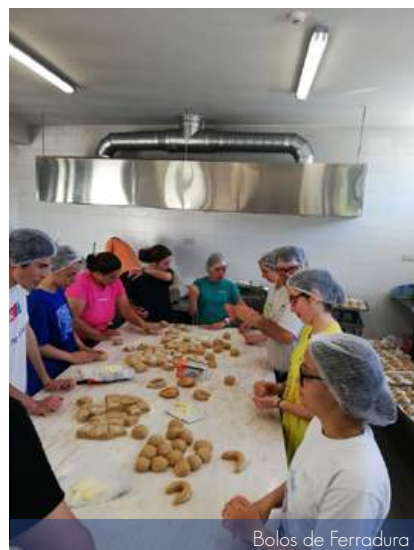
Bolos de Ferradura

ao Castro de Zambujal, onde realizámos um jogo por equipas mistas seguido de almoço partilhado. O regresso foi realizado novamente em caminhada de grupo.